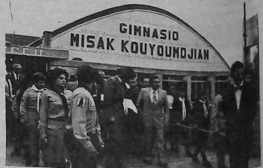
Ultima visita a su querido gimnasio.