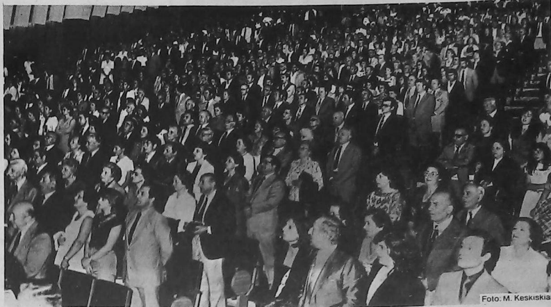
Vista parcial del público presente.

Nuevamente el Auditorio de la Misericordia se vistió de fiesta el lunes 22 de noviembre ppdo. para el recital de despedida de la delegación artística de Armenia.