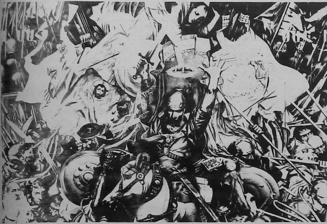
ՎԱՐԴԱՆԱՆԻՔ - Գործ Գ. Խաննեանի

երևանի նկարչական սրահին մէջ էր Գրիգոր Խաննեանի երկու վիթխարի նկարներու ցուցահանդէսը: Հոն հաւաքուած էին բոլորը՝ բանաստեղծ, նկարիչ, թղթակից երգահան (կոմպոզիտոր), պետական դէմքեր եւ ժողովուրդը, վայելելու մեր առաջին բազմամարդ ստեղծագործութիւնը: «Հայոց Այրուբները» 23, 2 քառ. մեթր մակերեսի վրայ կաճանկար էր, որ արդէն վերածուած էր գործիչի (գործիչներ, գործ է հիւսուած առանց խաւի թելերով): Առաջին անգամ Օպիստնի քաղաքի մէջ քննակող Գործիչն տոհմն է որ կատարած է այս աշխատանքը, հետեւաբար հիւսքը կոչուած է իրենց անունով): Մեծ հմտութիւն պահանջող գործ է, լաւագոյն վարպետը տարին 1 քառ. մեթր հազիւ կը կարողանայ ծածկել: «Հայոց Այրուբներ»-ի վրայ աշխատած են 19 ամիսներ եւ 12 վարպետներ իրենց ձեռքին տակ ունենալով 3000 երանգի թելեր: Գործի աւարտէն ետք գործիչները 3 օր ու գիշեր որպէս յուշարձան, ցուցադրուած է Օպիստնի հրապարակին մէջ, որպէսզի բոլորը տեսնեն հայ եւ ֆրանսացի վարպետներու տաղանդը ու