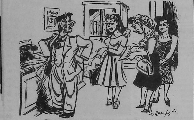
— Անպար, Ազգը հին է տուր ինձի, որ ես իրեն տամ