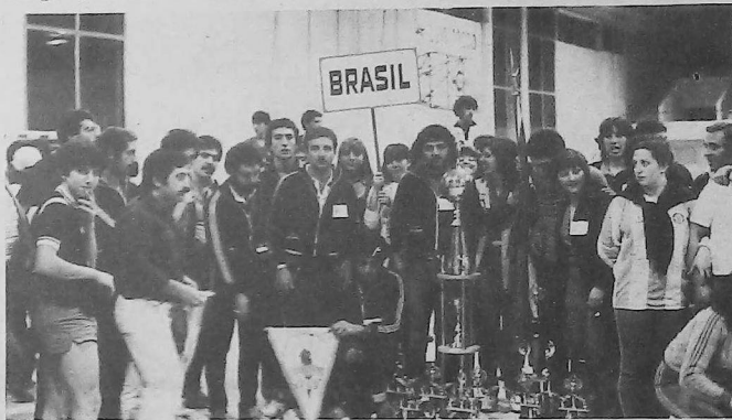
La delegación de Brasil se clasifica campeón de las Olimpiadas Interligas.