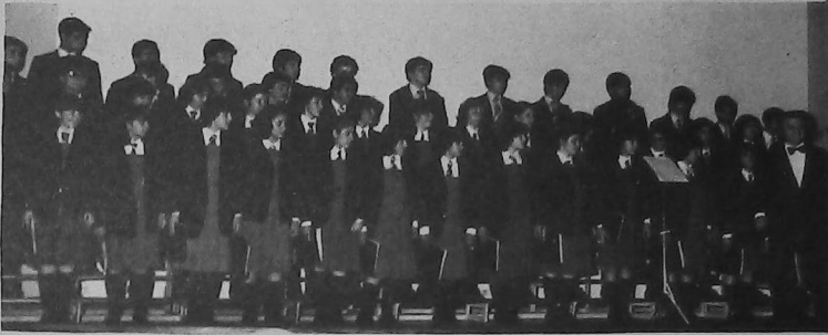
Coro Marie Manoogian