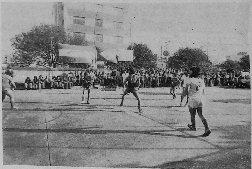
Secuencia del partido disputado en San Pablo, por la "Copa Armenia".

EL PARTIDO A JUGARSE EN EL ESTADIO DE "ATLANTA" contra LINIERS LE BRINDARA ESA OPORTUNIDAD.