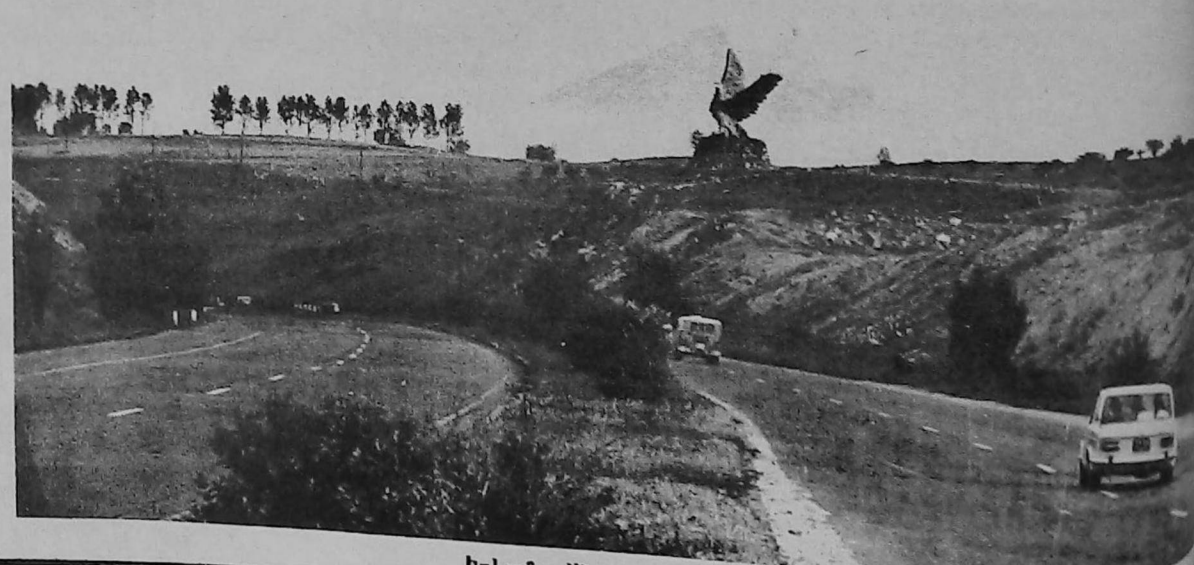
Երևան - Սեւան մայրուղին:

Արդարեւ, սպասելի բարեթիւն չկար, ինչ որ կը հանգստացնէր պատարագիչ Հօր դիտողութեան: Ապա ներկաները արտաքին զարթոյցով արտաքին ուր տեղի ունեցաւ մատարակ նուիրումն ու ճաշկերոյթը: