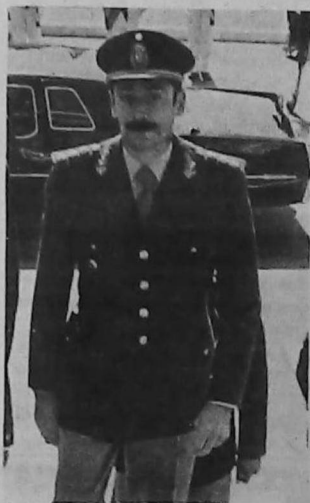
ideas básicas más allá de las personas de sus ejecutores. En ese contexto, quien habla, el presidente de la Nación, ejercerá sin mengua ninguna sus funciones; aquellas que le fueron

"Todo ello, para asegurar la estabilidad del sistema y la claridad de su funcionamiento, así como la continuidad de las