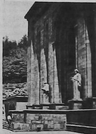
El Madenatarán, biblioteca de manuscritos antiguos, que es una de las más grandes del mundo.

Diversas colecciones particulares, instituciones públicas, bibliotecas, conventos de distintos lugares del mundo cuentan con manuscritos: en Siria, Libano y Egipto (1.000); en Irán (800); en los Estados Unidos (500); Francia (400); Inglaterra (400); Estambul (300); Italia (500); Alemania (200); Rumania, Bulgaria y Hungría (300), etcétera.