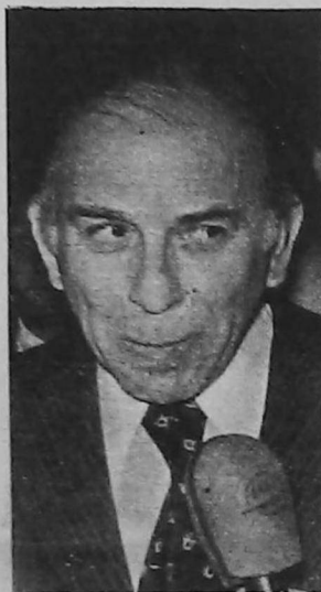
Horacio Tomás Liendo.

En una sencilla ceremonia que se llevó a cabo en la Residencia Presidencial de Olivos, el sábado 21 de noviembre ppdo. asumió, en forma provisoria, la primera magistratura de nuestro país, el General de División Horacio T. Liendo, quien, hasta el momento se desempeñó como Ministro del Interior.