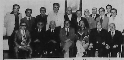
Diretoria Central da Ugab e o Homenageado.