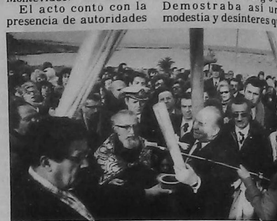
Acto de Colocación de la Piedra Fundamental, del Monumento a erigirse en Plaza Armenia.