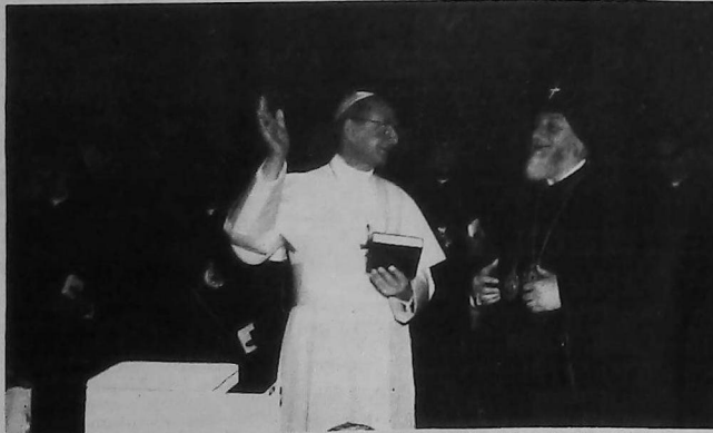
Vazken I° Catolicós de Todos los Armenios y Paulo VI en los Salones de la Biblioteca del Vaticano. - Mayo 1970.

el 8 de mayo de 1970, el Catholicos Vazken I°, acompañado de una gran comitiva compuesta de los Patriarcas de Jerusalem y de Estambul, de los Arzobispos y Obispos de la Sede de Echmiadzin y de personalidades civiles, representantes del pueblo armenio, llegaba a Roma para ser huésped de honor de S.S. Paulo VI. En su palabra de saludo