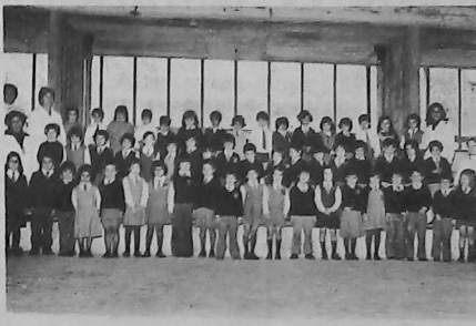
Alumnos del Jardín de Infantes del Instituto Nubarian, junto a las maestras de la sección armenia y castellana.