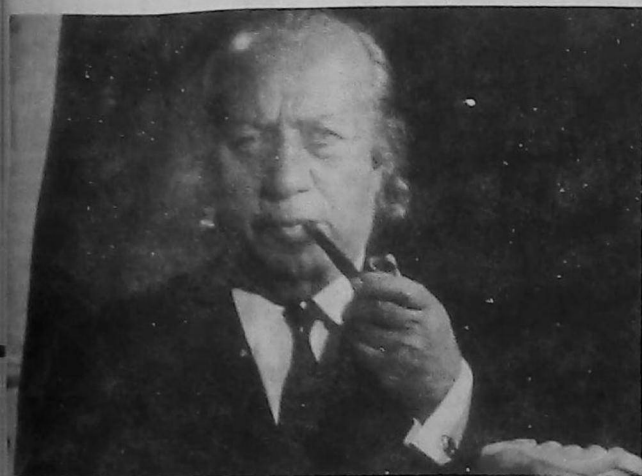
Նկարիչ Երուանդ Քոչար

Յաւ ի սիրտ կը տեղեկանանք թէ Երեւանի մէջ մահացած է հայ մեծանուն նկարիչ Երուանդ Քոչարը: