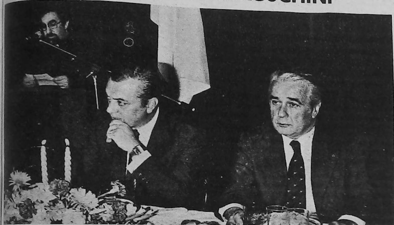
El almirante Lambruschini en ocasión de su visita al Colegio Mekhitarista.

El almirante Lambruschini se dispuso de periodistas y representantes de los medios de difusión, con motivo de su próximo pase a situación de retiro.