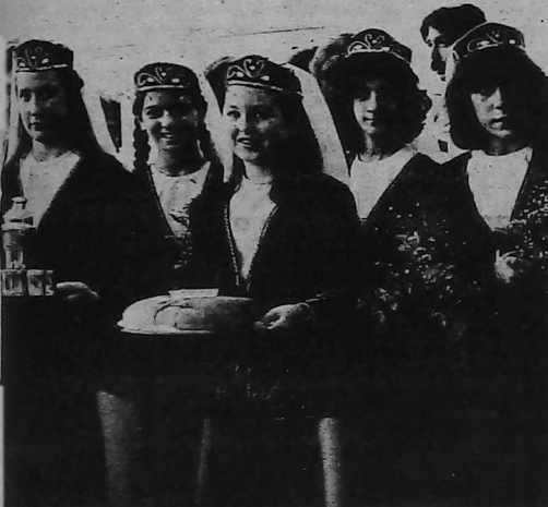
Alumnas del Inst. Alex Manoogian y miembros de UGAB reciben a los visitantes armenios.