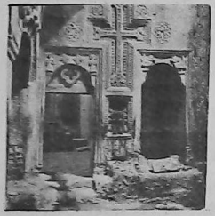
Գ Ե Ղ Ա Ր Գ

Այս հատորը նոսրում է Գոշպանքին, որ ԺԲ և ԺԳ դարերու ամենակարեւոր ճարտարապետական համալիրներէ մէկը եղած է: Բնագրերն են Արմեն Չարեանի և Հերման Վահրամեանի, պատմական ժամանակագրութիւնը՝ Արմեն Չարեանի 72 էջ, չափեր ունենալով 27 X 27 սմ., 28 գունատր և 9 սել ճերմակ նկարներով, ամբողջական հաւաքածոյ մը 14 էջով, հակերէնի քարգմանում: