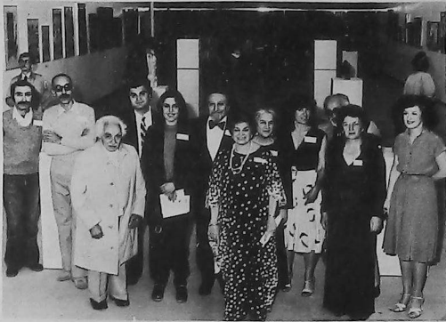
Los artistas que participaron de la última exposición.