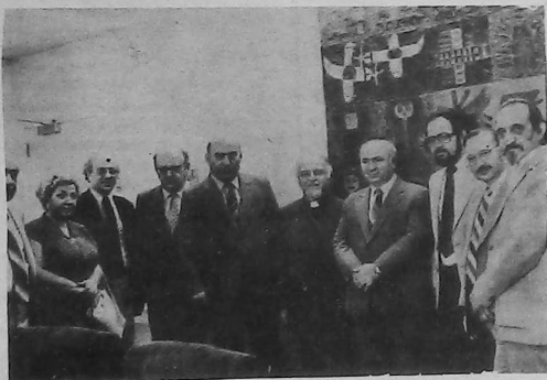
(Inf. Pág. 3)