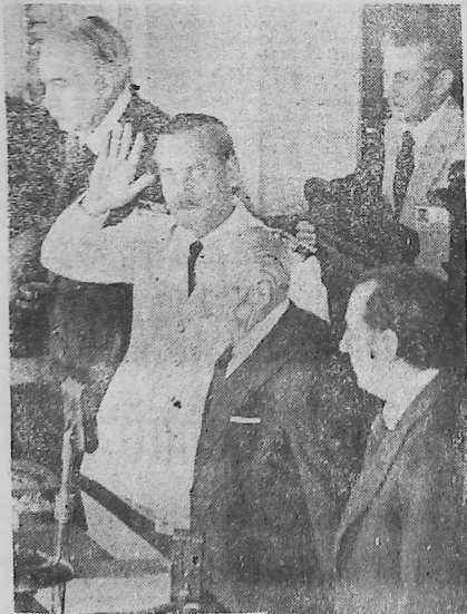
Presidente Gregorio Alvarez

Por su parte, la audición "La voz de Tekeyan" de la Asociación Cultural Tekeyan de Uruguay, que se difunde diariamente de 12 a 12,30 por CX 46 Radio América de Montevideo, dedicó toda su programación del día de la fecha al nuevo presidente, con el ánimo de augurarle éxitos en su gestión.