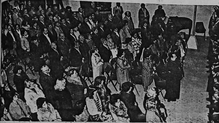
(Información página 3)