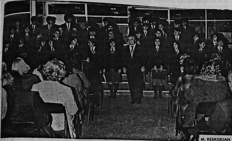
Coro del colegio secundario