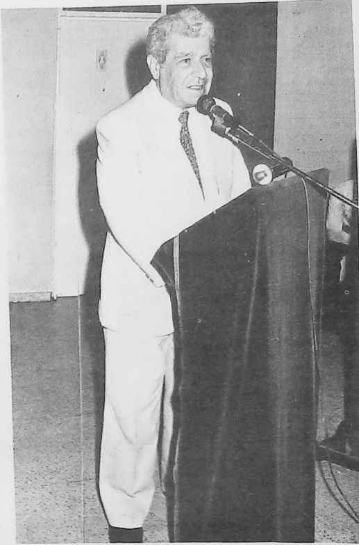
Պր. Վ. Համազասպեան ելոյթի պահուն

պիսան պաշ շնչոց հայկական զրօնքներու կարեւորութիւնը սիրելով մէջ եւ ապա մզկը ներկայները որ աւելի ուժով փարին Հայրենիքի գաղա-