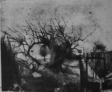
«Բնակար» — Գործ՝ Յակոբ Յակոբեանի

Առաջին իսկ հայեացքից Յակոբեանի նկա- րների կախարդական հմայքը բացատրում է նրա զգացումների պարզ եւ անկեղծ դրսեւորումով: Նա չի կեղծում իր մտորումները՝ վառ ղոյններ ծիածանի խաղերին հետամուտ չէ նա: Իր խա-