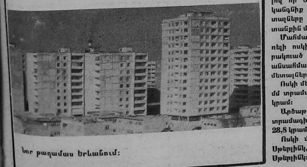
Լուր բազմաբնակարանային կառուցման արդիւնա-

Այս է գառ գիւղացի- ները կ'ուսնան անս առեւ- ջրակայ կեդրոններ, մշակութային-լուստարակաւ աստիճաններ, արդիւնա-