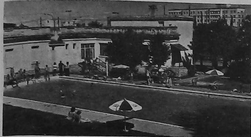
Vista parcial del predio de UGAB Córdoba

moral y filantrópica de todos sus integrantes, logrando así en los adolescentes notables progresos respecto de su formación física y cultural. Asimismo ha incrementado las relaciones sociales de la familia de Pare-