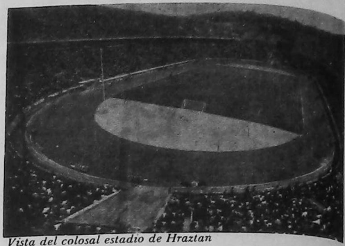
Vista del colosal estadio de Hraztan

En esa oportunidad Ararat venció por un score de 3 goles a 0 y desde entonces el estadio fue utilizado por el equipo Ararat para desempeñarse como local en sus numerosos encuentros del campeonato nacional y en los de carácter internacional.