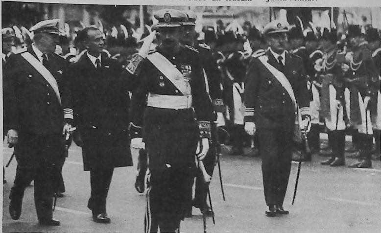
El Excelentísimo Sr. Presidente de la República Argentina, Jorge R. Videla y los miembros de su gabinete se dirigen hacia la Catedral Metropolitana.

en acción de gracias, al que asistieron los integrantes de la Junta Militar.