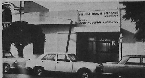
Frente de la escuela Sahag-Mesrob

llegada ha propiciado esta evolución digna del reconocimiento general.