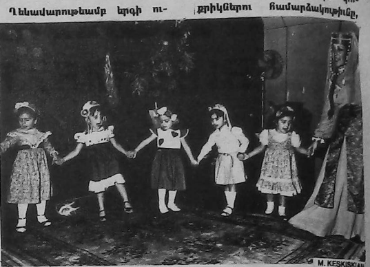
Սրբուհի էջեան մանկապարտեզի պատիկները հայկական պարի պահուսն:

Ճերմ, իրնց ուսուցչուհիներու ա - ուսանորդութեամբ, երգերով, պարերով և արտասանութիւ - ներով ներկայացուցին պատու - թեան բոլոր մասերը, շեղմ ծա - փանարութիւններ խելով ներ - կաներէն: Նկատելի էին փո - ճրիկներու համարձակութիւնը: