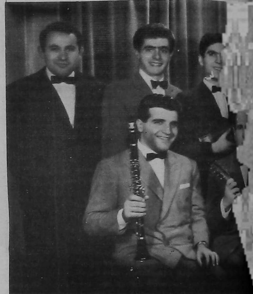
Conjunto Instrumental armenio "Tatul Altunian", año 1980

Es decir que, siempre con la dirección de Nubar Barsamian, a lo largo de sus veinticinco años de vida, el Conjunto Instrumental Armenio "TATUL ALTUNIAN" ha estado presente, con música de variados matices, en cuanta actividad lo requiera.