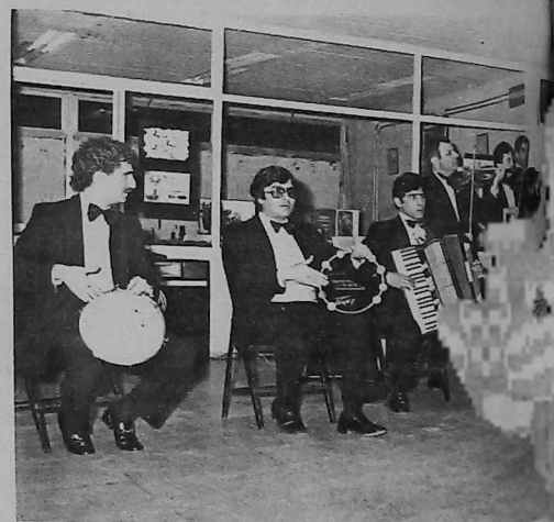
El actual conjunto, en una de sus últimas presentaciones