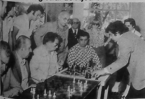
El gran maestro Internacional Armenio Rafael Vaganian en una sesión de simultaneas de ajedrez en la U.G.A. de Cultura Física.