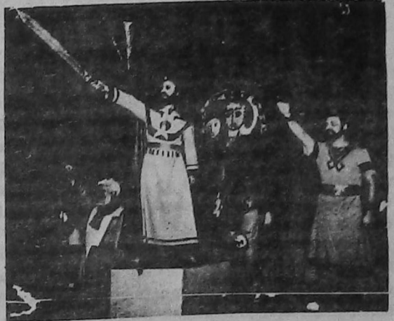
Տեսարան մը “Եղիցի Երկիր” ներկայացումէն

Քոմպոզիթոր Մարտին Իսրայելեանի երաժշտութիւնը համահնչուն է քեմականացուցեց, այն մերթ յադրական շեշտեր կը կրէ, մերթ՝ ցաւի ու կորուստի հնչիւններ: Իսկ Հայկական ՍՍՀ ժողովրդական արտիստ Վանուշ Խանաթրեանի քեմականացուցեց ազգային պարերը ուրոյն երանգ կը հաղորդեն ներկայացման: