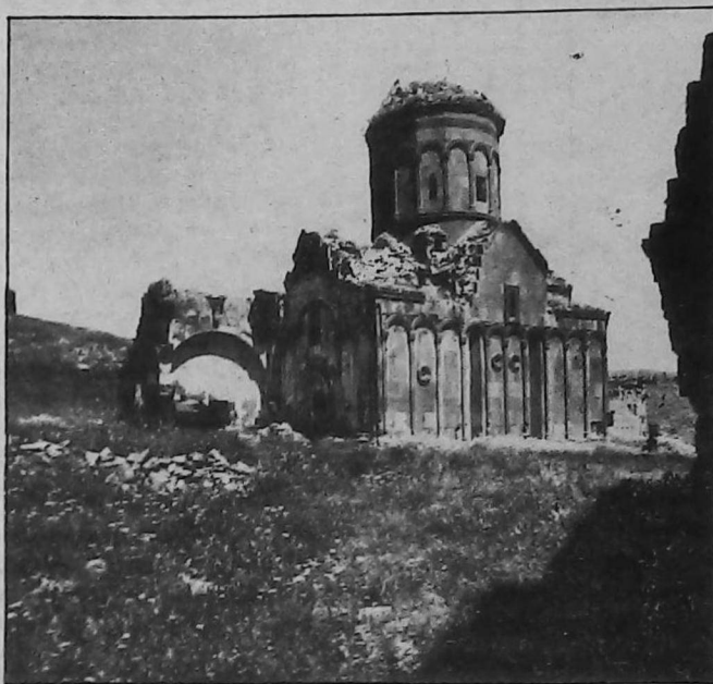
ANI: Iglesia Surp Krikor, Dikran Honentzi, construida en el año 1215.