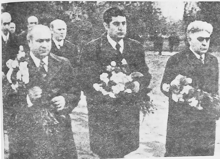
El 24 de Abril, el pueblo de Armenia —encabezado por sus gobernantes— se dirigió al monumento que evoca a los Mártires de Abril de 1915, en las afueras de Erevan. En la fotografía aparecen de izquierda a derecha F. Sarkissian, recientemente nombrado Primer Ministro; Gareh Demirjian y Papken Sarkissian, Presidente de Armenia.