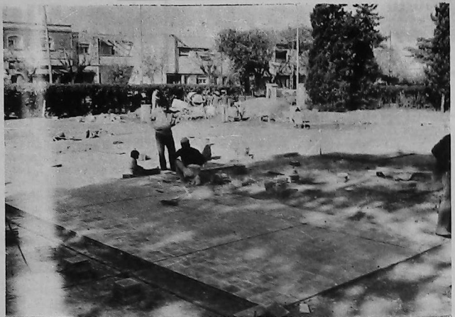
UGAB Córdoba: últimos detalles del nuevo Campo Deportivo.

A pocos días de cumplirse el 42º aniversario de Radio Armenia del Uruguay, cabe recordar — más que su fecunda historia — su verdadera función de institución representativa de nuestra comunidad. Con transmisiones de dos horas diarias, esta Primera Institución de Audiciones Radiofónicas Armenias en América del Sur, actúa como Prensa oficial de la Comunidad Armenia del Uruguay.