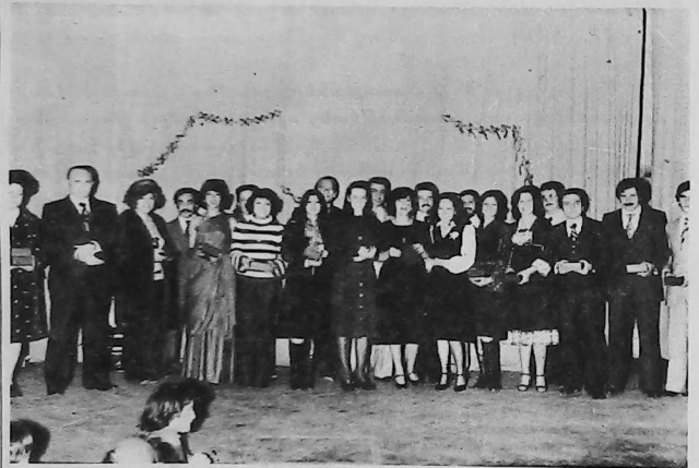
La Unión Patriótica Armenia de Marsh, el 20 de Mayo próximo pasado, realizó una cena de agasajo a los profesionales egresados descendientes de Marashstí. La misma —que fue organizada por la Comisión de Damas— contó con gran afluencia de público. La nómina de los agasajados, que son los profesionales recibidos en el período 1975/7 es la siguiente: