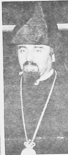
Arzobispo Karekin Sarkissian

El Arzobispo Karekin Sarkissian, destacado clérigo y prelado de la Iglesia Apostólica Armenia —afiliada a la Sede Patriarcal de Cilicia— fue electo Co-Adjutor Katholicos de la misma, el 22 de Mayo último. Dicha sede está ubicada en Antelias, pequeña ciudad mediterránea 10 millas al norte de Beirut, capital del Líbano.