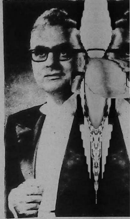
En su último concierto, el 29 de marzo pasado, el programa estuvo integrado por obras de Bach, Liszt, Mematzaganian y Gomidas.

En 1957, fue designado organista de la Orquesta Filarmónica de Boston, con cuays actuaciones ganó fama internacional.