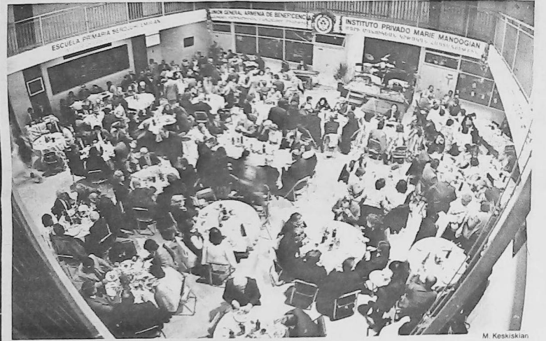
Vista parcial del público presente en la cena.

Debemos resaltar que el servicio de las mesas, estuvo a cargo de los alumnos, quienes de esta forma mostraron su integración a Parecordzagán.