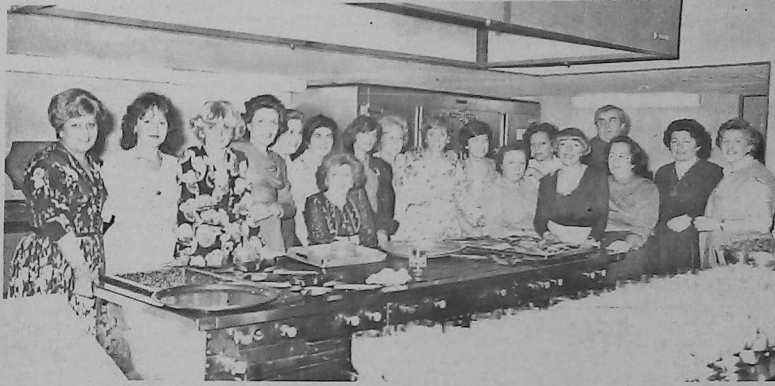
Ծնողաց տիկնանց անձնակազմը աշխատանքի մէջ

Խոր ցաւով կը դժուենք մահ Արի Տիգրիս Գոհար Տէր Ապիսկոպոսի որ տեղի ունեցաւ 5 Հոկտեմբերի երկուշաբթի օր: Ողբացեալը նուիրուած ապրեցաւ Հայց. Առաքել Եկեղեցու որուն ծառայեց մինչև վերջ: Իր զաւակները հար և Խուրէն, ինչպէս իր հարսը՝ Պէթի Պալասեանն ու Թոննըրը, ընտանեկան պարագաները և բարեկամները միշտ յարգեցին և յիշեցին զինքը: Այս տխուր առթիւ Սարտաբազա կուգայ իր խորին վշտակցութիւնները յայտնելու իր հարազատներուն և ընտանեկան պարագաներուն: