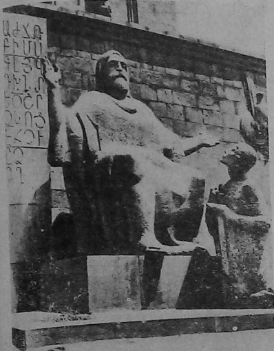
San Mesrob inició el despertar cultural del S. V, y la perpetuó con la creación del alfabeto armenio.

Durante el reinado del rey Vramshabuh (391-414 de J.C.) y el Pontificado de Sahak Barteved (390-439 d.J.C.) comienza para la Nación Armenia un período de breve paz política, atormentada hasta ese instante por persecuciones y matanzas de países invasores. En aquella época, los edictos y resoluciones oficiales, como así también las Sagradas Escrituras, se leían en griego, siríaco y persa. El pueblo armenio carecía de alfabeto, y ante las graves consecuencias que podría acarrear esta carencia para la fe cristiana, Mesrop (Mashdotz) que era un ferviente creyente y "tarkmanich", emprende con la ayuda de Sahak, la tarea de confeccionar un alfabeto armenio. El esfuerzo para realizarlo le insume dos años, entre el 404 al 406 d.J.C., y lo compone de 36 caracteres.