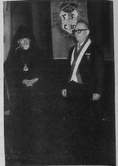
Dos pilares en la historia de las colectividades armenias en Sudamérica: el extinto Primado de la Iglesia Apostólica Armenia Monseñor, Papken Abadian, en momentos de otorgar el Orden de San Gregorio el Iluminador, conferido por el Katolikos Supremo de todos los armenios, Su Santidad Vazken I.