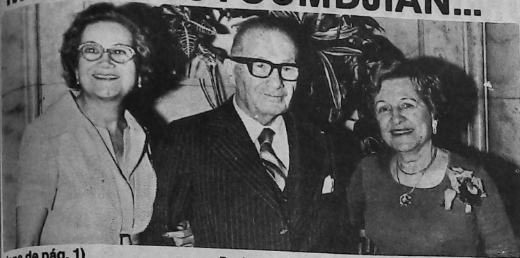
(viene de pág. 1)

en la construcción del templo San Versés Shnorall de la Iglesia Apostólica Armenia y del Centro Cultural Armenio de Montevideo.