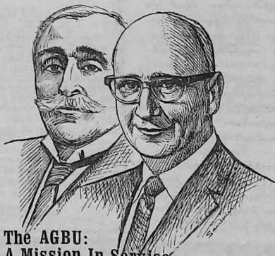
The AGBU: A Mission In Service To The Armenian People