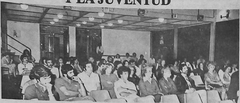
Durante la conferencia.