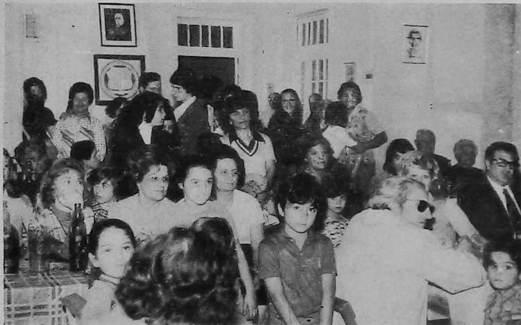
La Comisión de Damas, junto con sus colaboradoras, organizó en la Sede de UGAB de Córdoba, un almuerzo con congregó a más de 200 asociados quienes apreciaron una numerosa variedad de exquisitos platos típicos, preparados por este grupo emprendedor de Damas cordobesas.