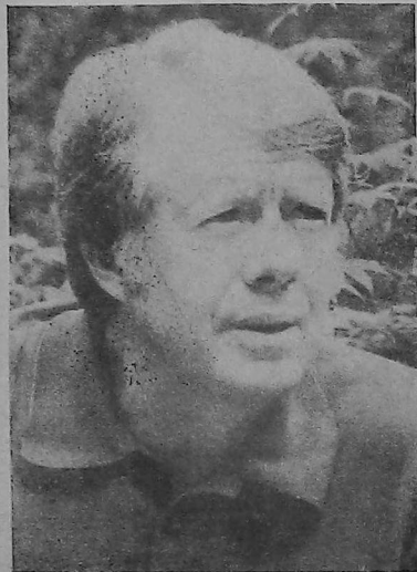
James Earl Carter, Presidente electo de los Estados Unidos de Norteamérica

Franqueo Pagado: Concesión Nº 2176 - Tarifa reducida: Concesión Nº 5276 - Correo Central - Sucursal 14