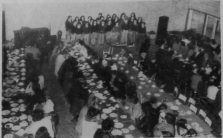
Numerosas personas concurrieron al Chocolate-Party ofrecido por la Comisión de Damas del Colegio Liceo Integral Armenio "Nubarian-Alex Manoogian", que contó con la participación del Coro de Niños, dirigido por el Profesor Luccini Rivas.