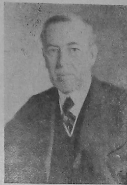
Woodrod Wilson, ex-presidente de la Unión

Estas declaraciones del dirigente norteamericano, se basan además, en el profundo respeto que siente hacia otro dirigente demócrata y ex-presidente de su país, el Sr. Woodrod Wilson quien durante muchos años demostró su comprensión hacia el pueblo armenio.