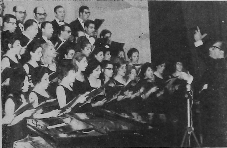
En forma ininterrumpida durante casi 20 años, el Coro Arax ha aportado a la Música, su arte y jerarquía

Durante el transcurso de estos 19 años, el Coro Arax ha ofrecido anualmente su presentación, destacándose el Concierto llevado a cabo en el Teatro Astral al cumplirse su décimo aniversario, en el que se interpretaron por primera vez obras clásicas europeas. En el año 1968, actuó en Radio Municipal y en numerosas oportunidades se lo encontró en los Conciertos organizados por la Facultad de Medicina de la Universidad de Buenos Aires.