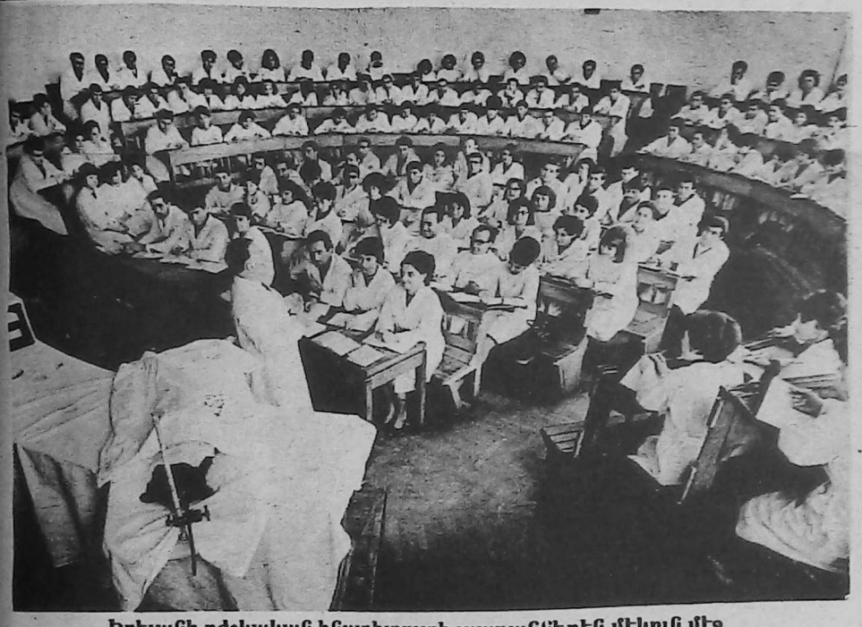
Երեւանի բժշկական ինստիտուտի լսարաններէն մէկուն մէջ