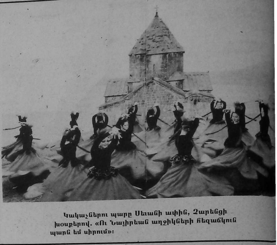
Կակաչներու պարը Սեանի ափին, Չարենցի խօսքերով. «Ու Նաչիրեան աղջիկների հեգանկուն պարն են սիրում»: