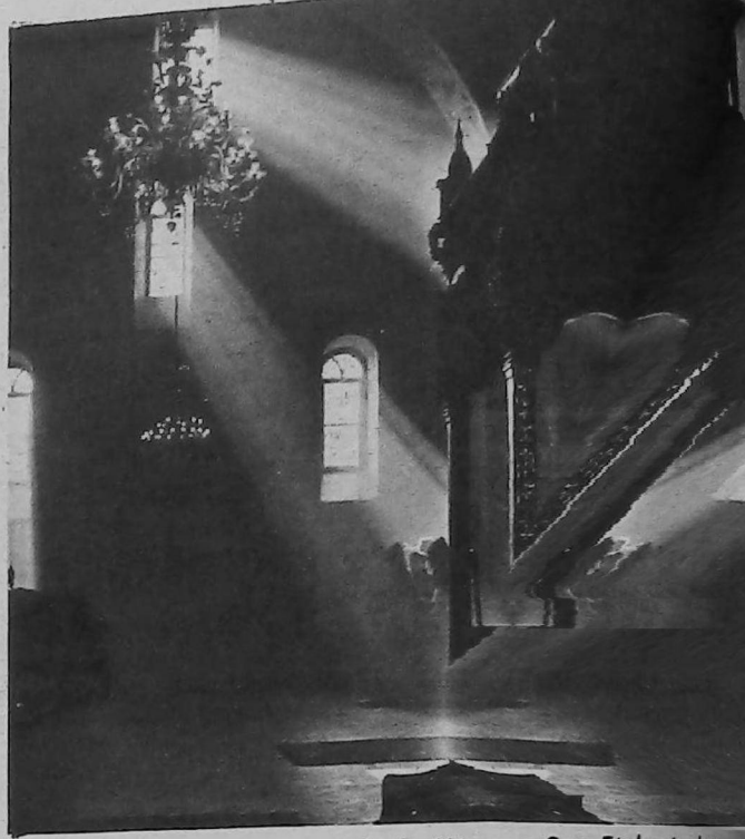
Su Santidad Vazken I preside la Misa en San Etchmiadzin.

Esas construcciones eran siempre, de una sola o de tres naves; frecuentemente construidas sobre las formas de los templos paganos. En algunos casos, esos mismos templos fueron transformados en iglesias, cambiando el ábside desde el oeste hacia el