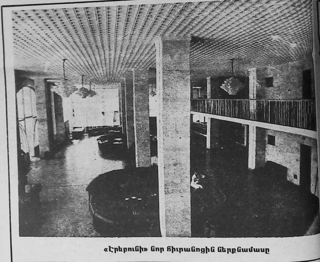
«Էրեբունի» նոր հիւրանոցին ներքնամասը

ներու պատմական, մշակութային եւ մարտարապետական քաղաքի յուշարձաններ՝ քերթեր, ամրոցներ, վանքեր եւ այլ կառոյցներ։ Երջանը մշակութային կեանքի կարեւոր վայր համարուած է։ Միջնադարում հոմ աշխատած են Միխայիլ Գօշ, Խաչատուր Տարօնացի եւ ուրիշներ։ Հոմ ծաղկած է գրչութեան արուեստը, ինչպէս նաեւ ժողովրդական արհեստները։