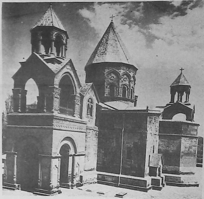
Santa Sede de San Etchmiadzin en Ereván, Capital de Armenia.

este del edificio. El estilo de las construcciones del s.V se caracterizó por catedrales de cúpulas centrales.