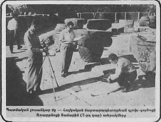
Պատմական լուսանկար մը — Հայկական ճարտարապետական դոկու-գործողի Ջուարթնոցի Տաճարին (7-րդ դար) անրակները

առաջին ջրանույցում աշտարակը ու տուրբինային երկու ագրեգատները: 1976 թուականի Դեկտեմբերի 28ին շարք մտու առումակակայանի առաջին հերթը: Նրա ուակտորի կարողութիւնը հաաար է 407 հազար կիլովատի: Իսկ երեք տարի անց՝ 1979ի Դեկտեմբերի 31ին, ոյժ հայթայթեց մաել երկրորդ էներգարույը՝ 407.5 հազար կիլովատ կարողութամբ: Հայաստանի ատոմակայանի դերը չի սահմանափակուում միայն ելկտրակաում ոյժ արտադրելով: Դրա ու երեւանի, Կիրովականի ու Հրազդանի ջրմաելկտրակետրոնների գործարկումով լուծուեց մաել մէկ այլ կարեւոր հարց՝ դադարեցուեցին Սեւանայ լճի ջրերի այսպէս կոչուած էներգետիկ րացքողումները: (յապաուած)