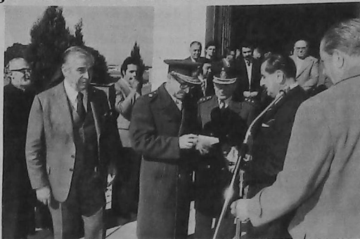
Autoridades del Colegio Militar