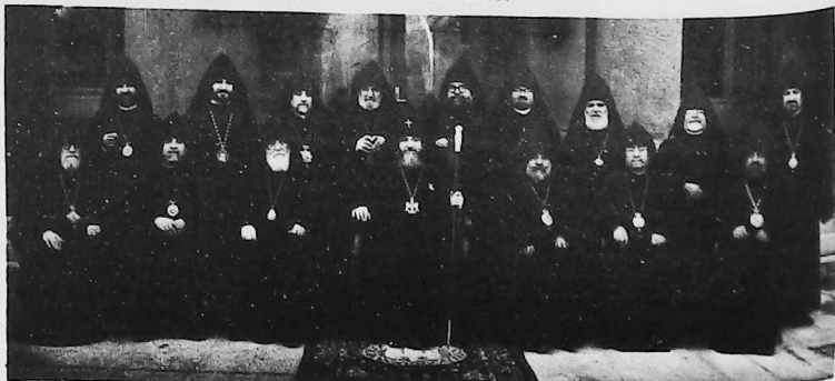
•1966. Último viaje a San Etchmiadzín