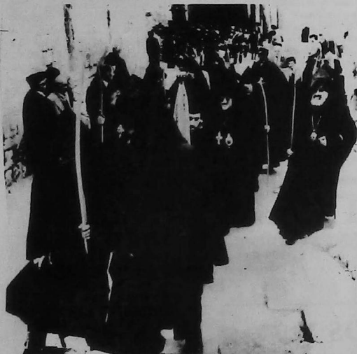
Jerusalén: Peregrinos cristianos abandonan la Iglesia del Santo Sepulcro después de las celebraciones del domingo de Pascua.