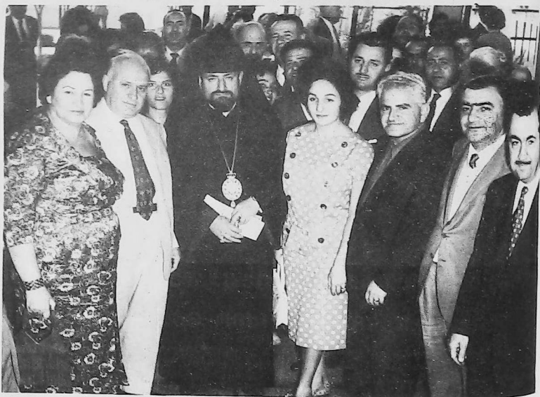
•1959. Primera visita a San Pablo.