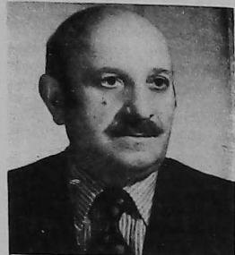
mejor trabajo de las Jornadas Científicas del Hospital Alvear.

Cabe destacar que fue uno de los cinco jefes designados entre los 35 cardiólogos que se presentaron para dicho concurso. Como es de público conocimiento, en repetidas oportunidades obtuvo premios científicos; entre ellos el "Francisco Arrillaga" de la Facultad de Medicina en 1970, de la Asociación Médica Argentina en 1974 y últimamente, el premio al