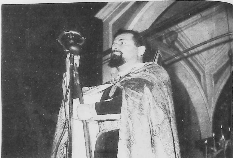
•1959. Primer oficio religioso en Buenos Aires

Nosotros confiamos en que el mensaje que nos dejó nuestro querido jefe espiritual permanece en el corazón y en la voluntad de la clase dirigente de nuestra colectividad. Así como es posible la unidad para conmemorar fechas como el 24 de abril, así como es posible reunirse alrededor de una misma mesa para planificar la campaña de ayuda a nuestros hermanos del Líbano, así también podría concretarse, ya que están dadas las condiciones, un régimen de participación y equilibrio en la conducción de la colectividad aquí, en Buenos Aires, donde tienen su asiento sudamericano todas las instituciones comunitarias armenias.