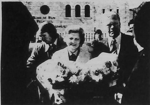
Recientemente, el ex-presidente de los Estados Unidos, Sr. Gerald Ford, en compañía de su esposa, Betty, visitó el Patriarcado Armenio de Jerusalén, durante una corta estadía en Israel.