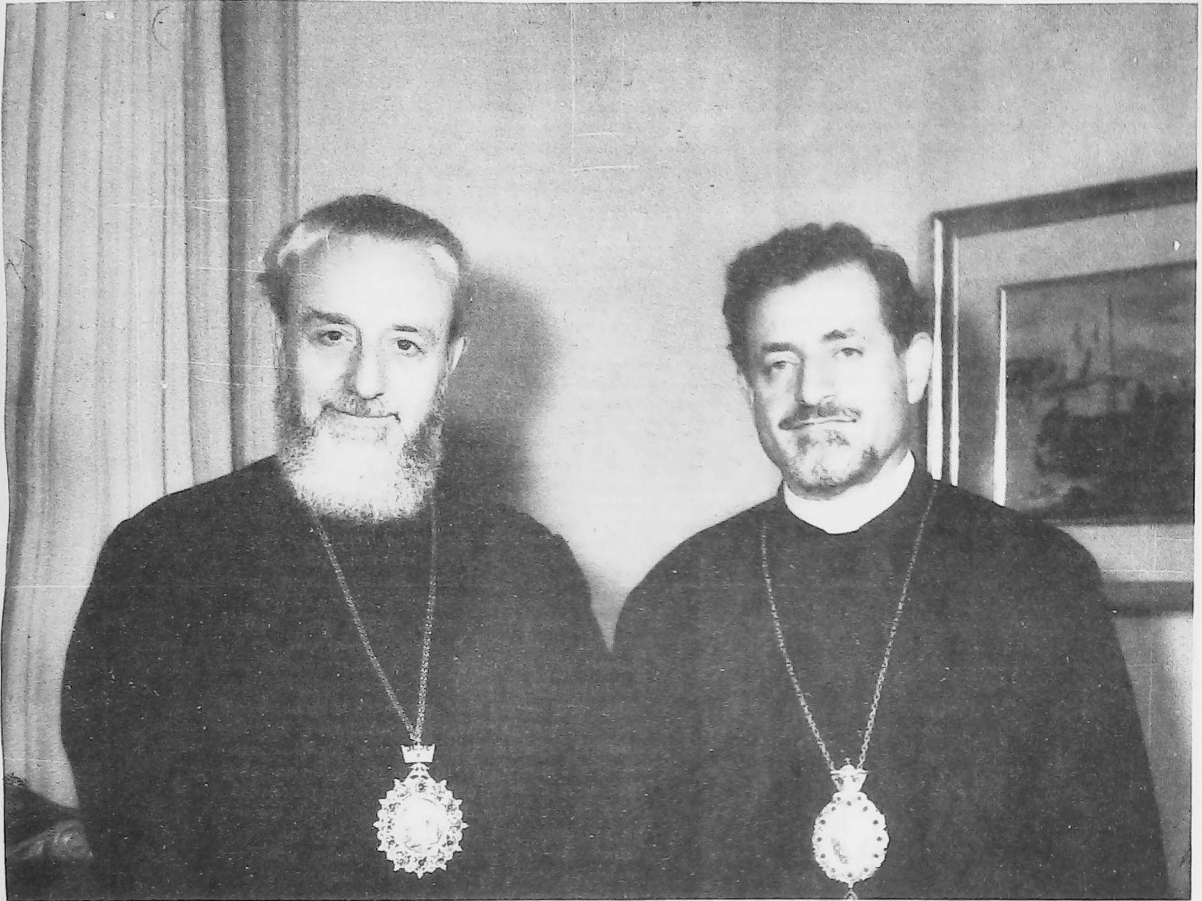
Ն.Ս.Օ.Տ.Տ. ՎԱԶԳԷՆ Ա. ԱՄԵՆԱՅՆ ԼԱՅՈՑ ՎԵՂԱՓԱՌ ԼԱՅՐԱՊԵՏԸ