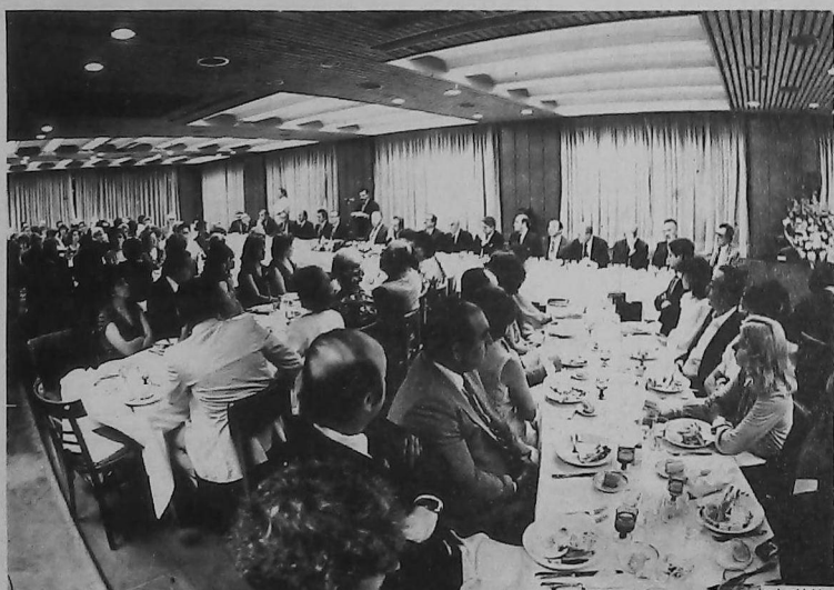
Vista parcial del público.

կանգնուածներու ան- դամ Մովակալ Գարուս Սան- չէս Սաննուտոն, Գարիբալ- Տէ Զրակաթա Աքիլիոյ Պար- պատորին, Լա Փրէմաս Օրա- քիբրի Ընդի. Տնօրէն՝ Յարու- նտէ Կանասան, Ազատական- ներու Պաշտօնական Խմբակի Նախագահ Պր. Ռոտովօ Վի- նելլին, Ընդի. Ազգային Թան- հարաններու տնօրէն՝ Յարու- նտէ Զոնթանուտան, Նա- խագահ Զօր. Արամպուրտի եւ Նախագահ Զօր. Լէվինկարոնի չբջաններուն Առեւտրական եւ Արտաբիւս Առեւտրական Ու- սարար Պր. Խուան Ժամասա- րուը, Ապիլին Ֆետերալ Դա- տարո Տոճք. Ռաֆայէլ Սար- միէնթօն, Իրիկոմէնան Քա- ղաքականութեան ղեկավար՝ Տօճք. Ալպերթօ Աստօքը: