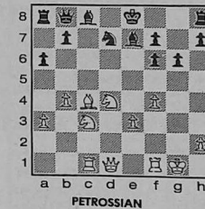
a b c d e f g h