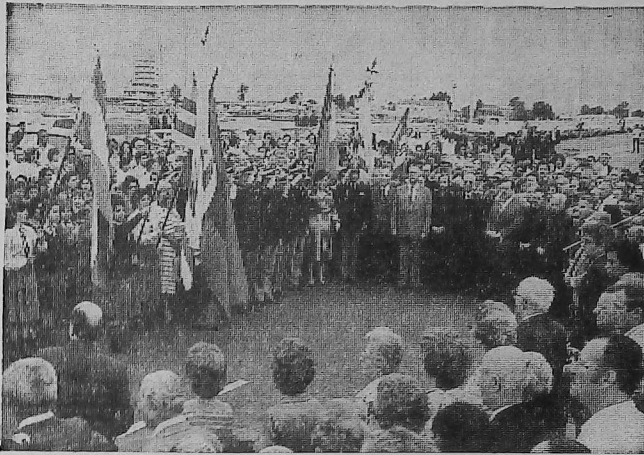
Emotivo acto se desarrolló ayer de tarde en ocasión de inaugurarse el monumento en Plaza Armenia.