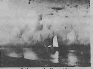
Bathers on the Shore, 1866 Ivan Aivazovsky

Յովհաննէս (Իվան) Այվազովսկիի (1817-1900), Ռուսիոյ ամենէն անլի զնահատուած ծովանկարիչին եւ հայ- կական ծագումով ամենէն միջազգայնօ- րէն ծանօթ արուեստագէտին գոր- ծերուն քաթալոկը պիտի հրատարակուի եւ ցուցահանդէսը պիտի կազմակեր- պուի.— «ԱՅՎԱԶՈՎՍԿԻՆ ԱՄԵՐԻԿ- ԵԱՆ ՀԱՒԱՔԱԾՈՆԵՐՈՒՆ ՄԷՋ»: Ծուցահանդէսը ինչպէս անոր ընկե- րակցող անգլերէն քաթալոկը առաջինը պիտի ըլլան առանձնապէս նուիրուած՝ Այվազովսկիի Ամերիկայի բազմաթիւ գործերուն: Ծարդ, ան արժանաւորապէս չէր՝ ներկայացուած անգլիախօս հան- րութեան, ինչպէս նաեւ ամերիկեան շրջանակին: Քաթալոկը, որ պատկե- րազարդուած պիտի ըլլայ սեւ-ճերմակ