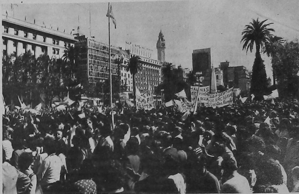
Un numeroso público se dio cita en Plaza de Mayo, desde tempranas horas del 2 de abril.

pueblos liberados durante nuestras gestas libertadoras, pero no hemos de doblegarnos ante el despliegue intimidatorio de fuerzas británicas, que lejos de haber usado las vías pacíficas de la diplomacia han amenazado con el uso indiscriminado de esas fuerzas".