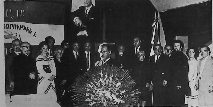
Un grupo de personalidades asistentes al acto en memoria del Papken Abadian