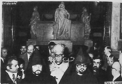
Miembros del Clero Armenio se retiran de la Iglesia Catedral.