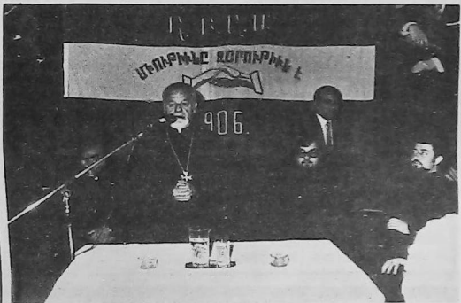
Ս. Արշաւ Բնչ. Պողոսեան

Ապրիլի 28ին, առաւօտեան ժամը 9:30ին, ՀԲԸՄիութեան Մարի Մանուկեան Կրթական Հաստատութեան աշակերտութիւնը յատուկ յուշատանով մը ոգեկոչեց երջանկայիշատակ Ս. Բարգէն Արք. Ապատեանի վախճանման առաջին տարեկիցը: