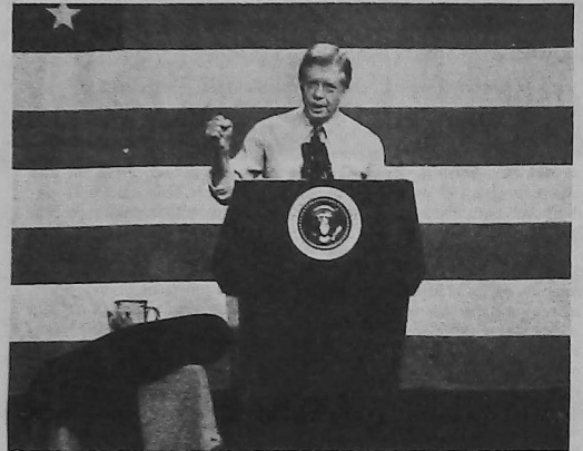
Presidente Jimmy Carter.

No he conocido ningún país que haya dado proporcionalmente tanto para el desarrollo de las artes, música, teatro, comercio, política y educación cuanto los armenios. Y por ese