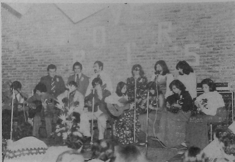
Conjunto de Guitarras "Hay Kussanner"

Con gran pompa se festejó este grato evento de la familia Scout de UGAB, que tuvo lugar en la noche del sábado 5 de Junio próximo pasado.