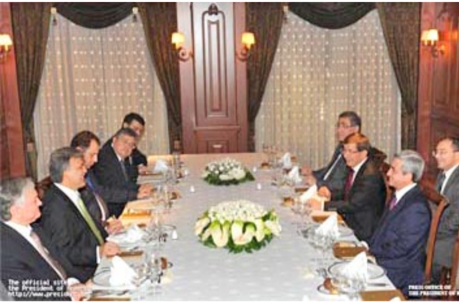
Durante la cena ofrecida por el Presidente Abdulah Gul a su par armenio, Serge Sarkisian y las comitivas oficiales.