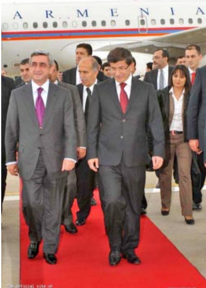
El Canciller Ahmet Davutoglu recibe al Presidente de Armenia y su comitiva.

Luego del partido el Presidente de Armenia y su comitiva regresaron a Ereván.