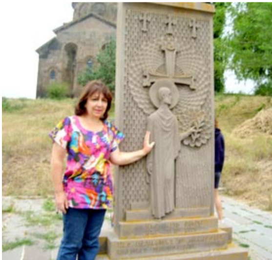
Iglesia Sisaván, del S. VII, y el nuevo jachkar de Gomidás.

cementerio está en la parte alta, al lado de la iglesia Surp Hovhannés, o Sissaván, o Siuní Vank la llaman (en realidad, su nombre es San Gregorio el Iluminador). Es del siglo VII, del estilo de la genial Hripsimé, guardando similitudes con ésta: plano cruciforme, con cuatro ábsides. Es de basalto color negro, y así, su contorno se destaca nítidamente desde la