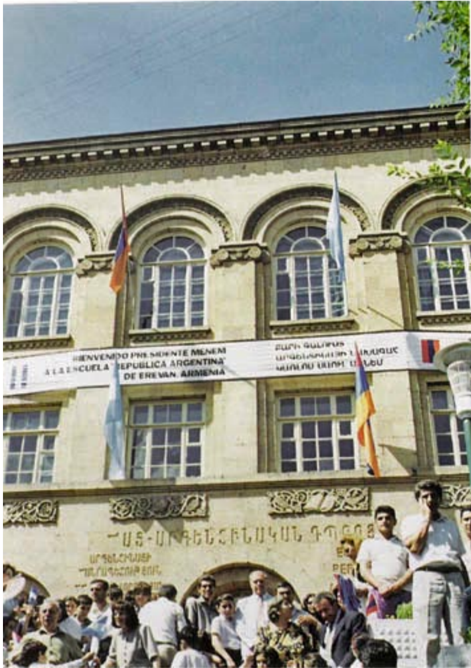
Երեւանի Արժանթինեան Հանրապետութիւն Դպրոց

առանց պարտադրանքի ու բռնագրօսիկ միջոցներու, կը սողոսկի մանկական եւ պատանեկան հոգիներու մէջ ու մաս կը կազմէ անոնց նկարագրային ու անհատական ինքնութիւններուն: