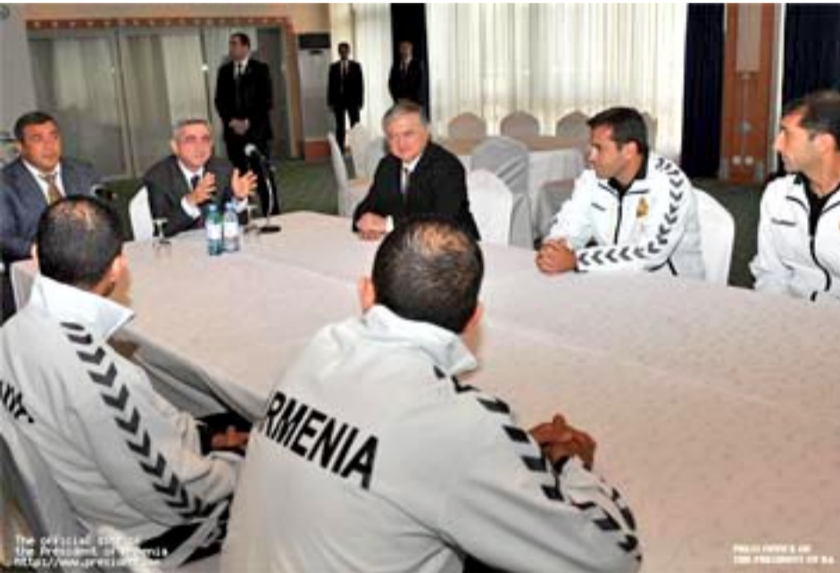
El Presidente Serge Sarkisian alienta a los jugadores armenios antes del partido.