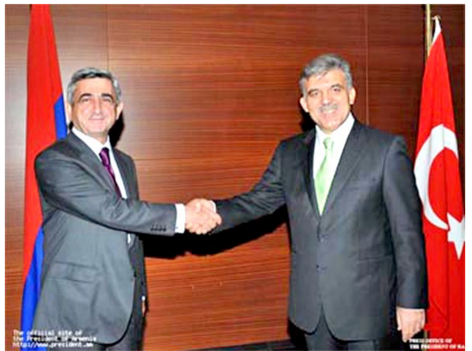
El saludo oficial de los Presidentes Sarkisian y Gul en Turquía.

El Presidente Serge Sarkisian señaló que la República de Armenia está determi-