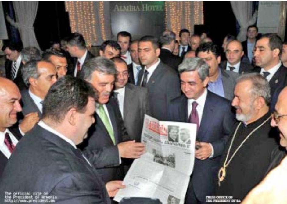
En la recepción, los Presidentes comparten la tapa del diario «Yamanag» que se edita en Estambul, con su editor y demás invitados especiales.