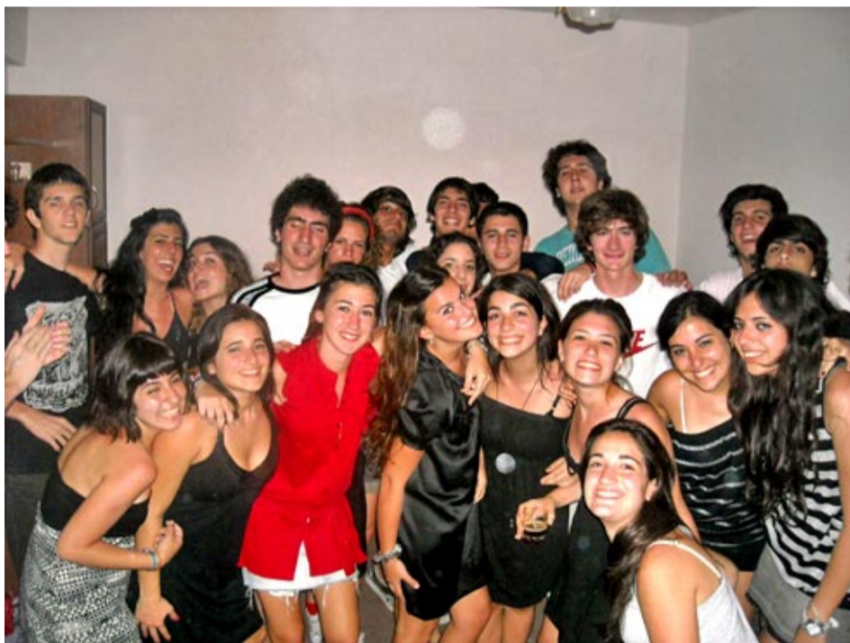
El concurrido cumpleaños en las cabañas de Sisián.

No creo que en Sisián olviden fácilmente a esta Promoción. Por el entusias-