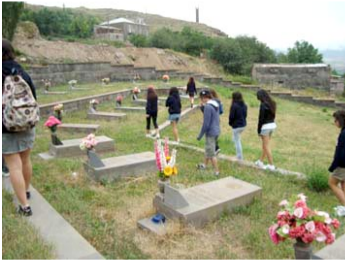
Los alumnos recorriendo las tumbas de los jóvenes héroes de Sisián.

pedras con formas de carnero, del siglo IV. Después, subimos la colina, hacia las tumbas de los caídos en la guerra de Karapagh. Sisián dio muchos héroes. Con pena, comprobaron que los soldados tenían su misma edad: 18, 19 años. El