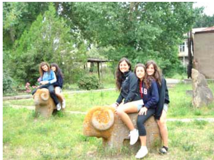
En el Karatarán, Museo de Piedra.

Arreciaban los cantos en coro. Risas. Los varones querían reivindicación