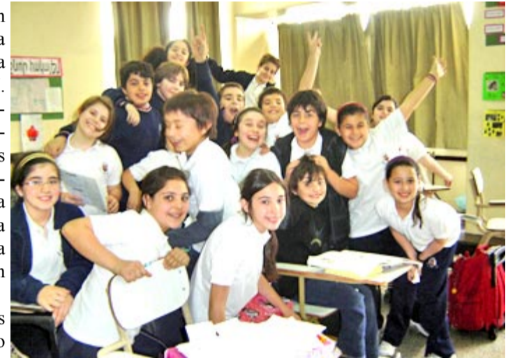
Los chicos festejando las cortinas nuevas.